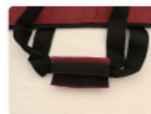
持ち手カバー付き