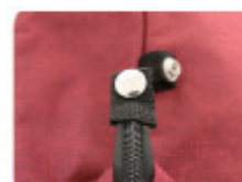
サイドのスナップボタン