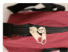
ダブルファスナー