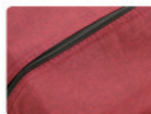
丈夫なオックスフォード生地