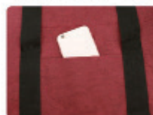
スマホも入る簡ポケット